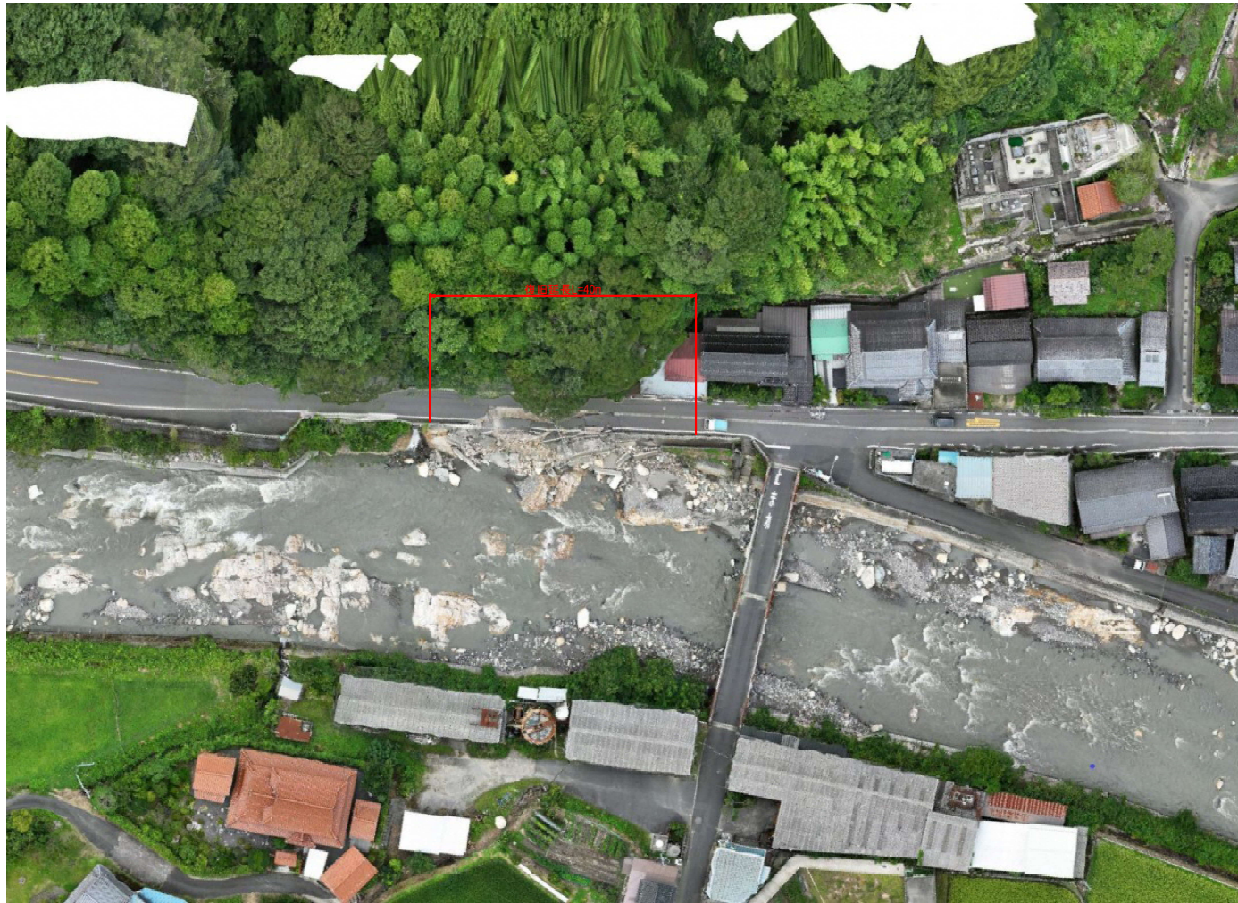
佐治町古市 オルソ画像