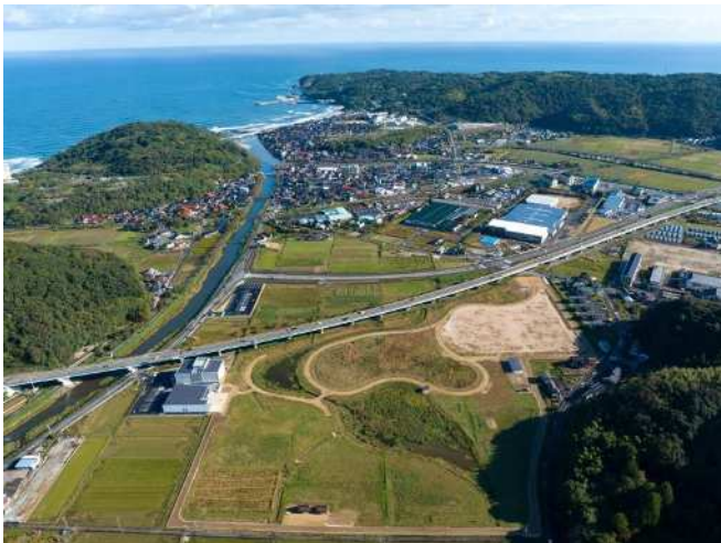
公開済みの指定地南側工区

地域住民、地域の学校（青谷小学校・青谷中学校・青谷高等学校）による史跡公園の活用を核として、弥生時代の暮らしや技術を体感するための取り組みを推進します。