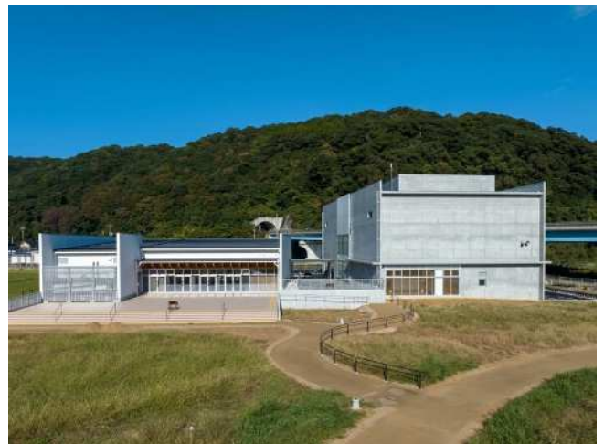
展示ガイダンス施設(愛称:YAYOINE(やよいーね))