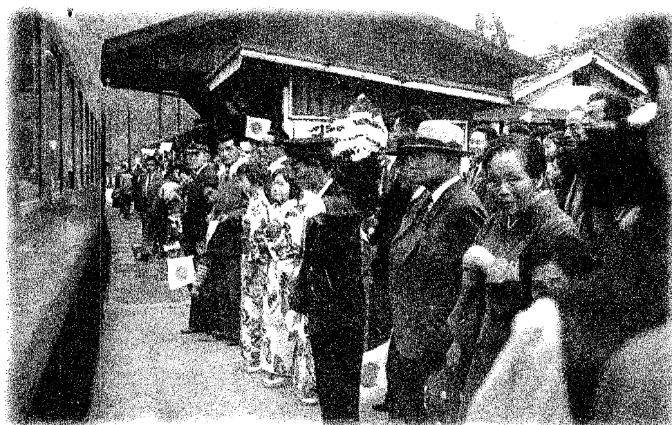
1966年(昭和41年)生山駅初の急行列車の停車を待つ人々。

今年、JR伯備線 生山駅が1923年(大正12年)11月28日に開設されてから90周年となります。これを記念し、伯備線の開設から戦前・戦後・高度経済成長期へと変化し続けてきた懐かしの伯備線沿線と生山駅の鉄道写真や資料の数々を展示します。皆さまの記憶と共に頭の片隅に残る懐かしの風景をご覧ください。