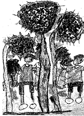
「ひまわりのたねをとったよ」1年生 海野智哉(岡山県 建部小学校)