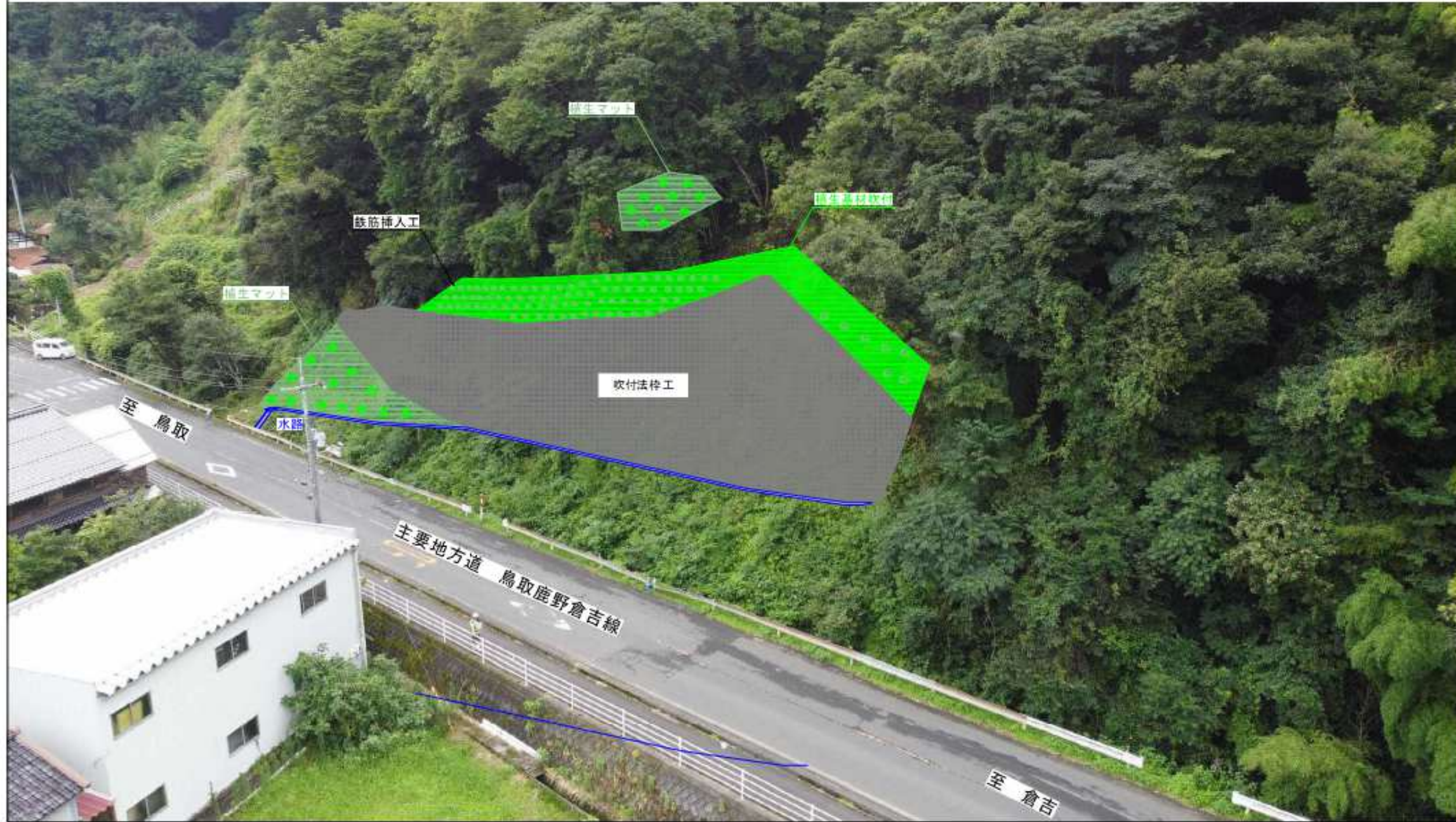
[斜面对策工 イメージ図]