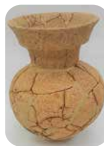
製作する壺のモデル

妻木晩田遺跡出土のシンプルで美しい壺を製作します。 高難度ですが、ぜひ挑戦してみてください！