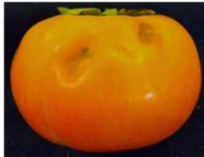
カキ‘富有’の果実被害