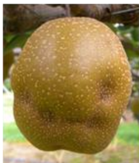
ナシ‘王秋’の果実被害