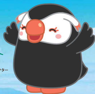
北方領土イメージキャラクター 「エリカちゃん」

2月7日は 「北方領土の日」だっぴ。 この機会と一緒に 北方領土問題について 考えてみるっぴい～。