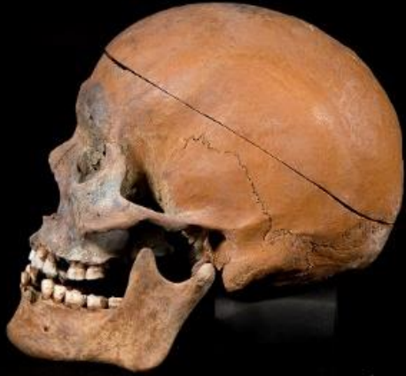
復顔像を制作した青谷弥生人の頭蓋骨（西暦2世紀）