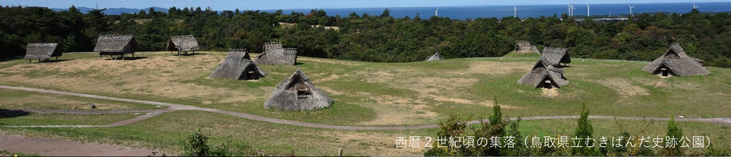
西暦2世紀頃の集落（鳥取県立むきばんだ史跡公園）