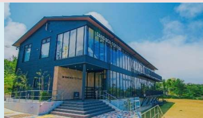
SAND BOX TOTTORI(外観・内観)