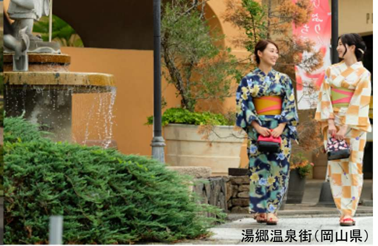
湯郷温泉街(岡山県)

◆貸切バスで、鳥取県智頭エリア・鳥取砂丘周辺と岡山県美作エリアを2泊3日で巡りながら地元起業家との交流会や体験プログラムを行うワーケーションモニターツアー