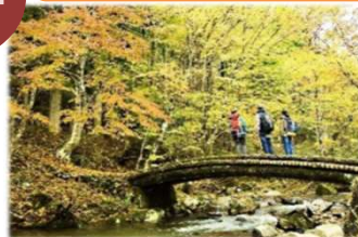
森林セラピー体験

森林浴から一步進んだ「医学的な証拠」に裏付けされた森林浴効果のことで、森を楽しみながらこころと体の健康維持・増進、病気の予防を行うことを目指します。(雨天の場合は、屋内で実施する他の体験に変更になります。)