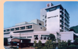
湯郷グランドホテル