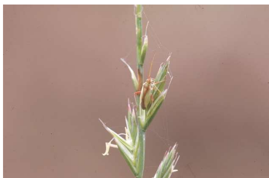
写真1 アカスジカスミカメ

注) 数字は捕虫網5往復10回振りすくい取り成幼虫数、括弧内は発生か所率を示す。巡回調査定点地区及びその周辺地区のイネ科雑草地（2～3か所/地区）などを調査。平年値は平成28年～令和5年の平均値（ただし、令和2年と令和3年は調査未実施）。