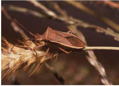
写真3 ホソハリカメムシ