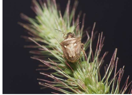
写真4 トゲシラホシカメムシ