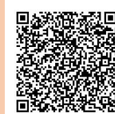
【とっとり電子申請システム】

お申込みは「とっとり電子申請システム（下記URL又は右記QRコードからお願いします）。