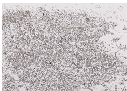
「白昼都鄙」 矢間 舜 (中2・米子市)