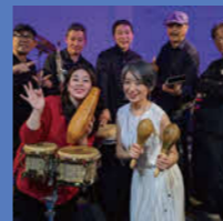
エストレージャス (サルサ&ラテンジャズバンド)

鳥取で活躍するジャンルの異なる4組のアーティストが「MY HOMETOWN 鳥取」をテーマに、一夜限りのサウンドを奏でます。