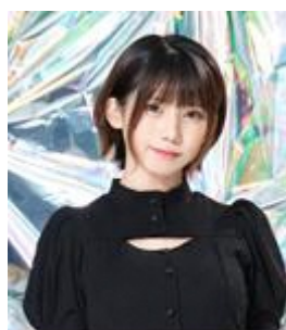
えなこ クールジャパン 広報大使 コスプレイヤー、 グラビアアイドル、 タレント、歌手、