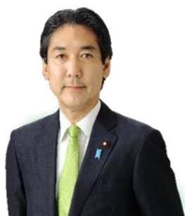
城内 実 内閣府特命担当大臣 (クールジャパン戦略)