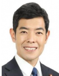
辻 清人 内閣府副大臣