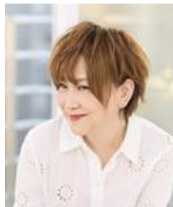
松本梨香 クールジャパン広報大使 歌手、声優

「ポケットモンスター」の主題歌「めざせポケモンマスター」はダブルミリオンを記録。 今年デビュー40周年記念として Anniversary LIVE と主演舞台が決まっている。