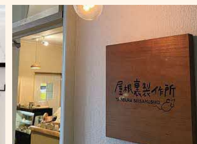
鳥取市湖山町東1-370 ピアザビル 2F