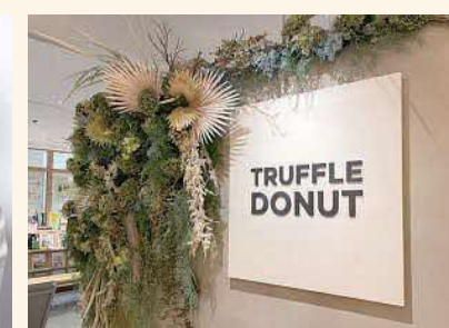
鳥取市今町2-151 丸由百貨店 5F