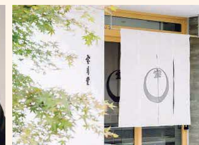
鳥取市二階町3丁目121