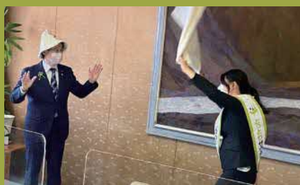
とっとりサウナ CEA 就任式（鳥取県庁） アウフグースの風をうける平井知事