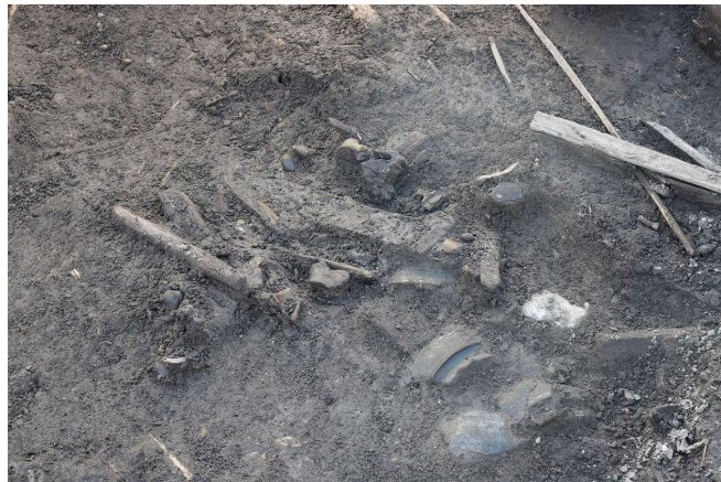
弥生時代後期後葉 (約1,800年前) の人骨出土状況