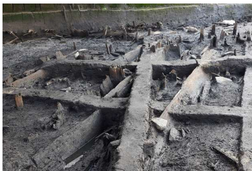
弥生時代終末期 (約1,750年前) の造成遺構