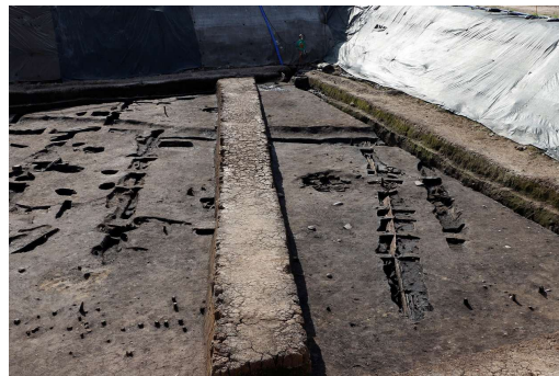
古墳時代前期前半 (約1,700年前) の平地式の建物跡