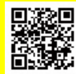
【雇用人材局ホームページ】

https://www.pref.tottori.lg.jp/koyou-jinzai/