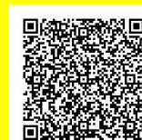
【とっとり電子申請システム】

お申し込みは「とっとり電子申請システム（以下URL又は右記QRコード）からお願いします。 https://apply.e-tumo.jp/pref-tottori-u/offer/offerList_detail?tempSeq=11237