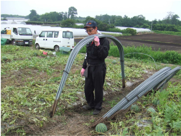
トンネル支柱を肩に担いで運ぶ様子

こうした状況から、平成 25 年度倉吉西瓜生産部生産者全戸を対象にアンケートを実施。回答者のうち 5 割から改善要望のあった「トンネル支柱運び」改善策について、平成 28 年度から運搬車に器具を取り付け運搬する方法に取り組んだ。