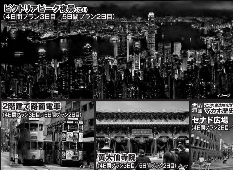
ビクトリアピーク夜景(夜間) (4日間プラン3泊目 / 5日間プラン2泊目)

※目安 燃油サーチャージ15,000円(2024年9月6日現在)、今後、原油価格の変動により金額が変更されることがあります。 ※国内空港施設使用料および海外空港諸税、航空保険特別料、国際観光旅客税が別途必要となります。