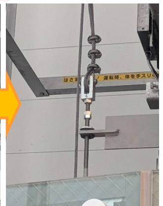
5号機復旧後の固定器具