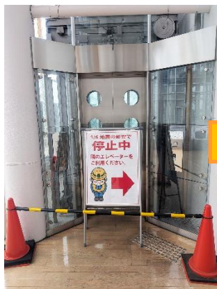
1/8～1/26 5号機停止中の表示