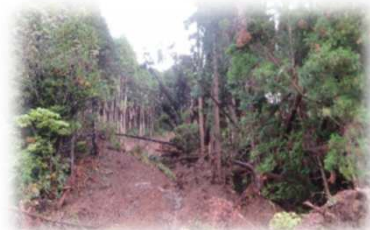
▲豪雨災害が発生した森林