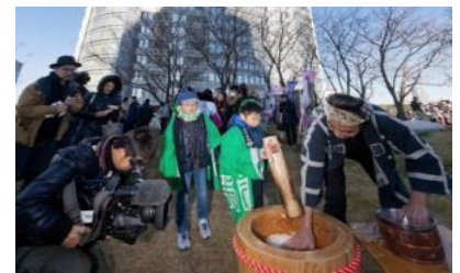
『もちつき』イベントの様子 (1月頃)