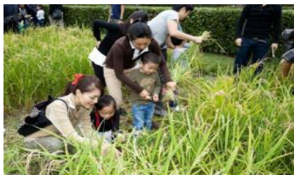
『稲刈り』イベントの様子 (9月頃)