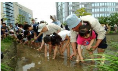
『田植え』イベントの様子 (5月頃)

四季折々の樹木と水田・菜園とが融合した六本木ヒルズの屋上庭園は、通常非公開のエリアです。例年、『田植え』、『稲刈り』、『もちつき』をはじめ、生物観察や草木を使ったワークショップなど、様々なコミュニティ活動の場として活用しています。また、これらのコミュニティ活動への参加者は、居住者をはじめ、六本木ヒルズ内店舗および施設の従業員、オフィステナントのワーカーにまで拡大。活動も非常にご好評いただいております、リピーターも増えています。