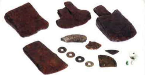
(出品されるのは一部です)