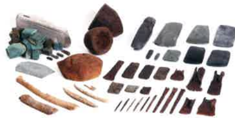
(出品されるのは一部です)