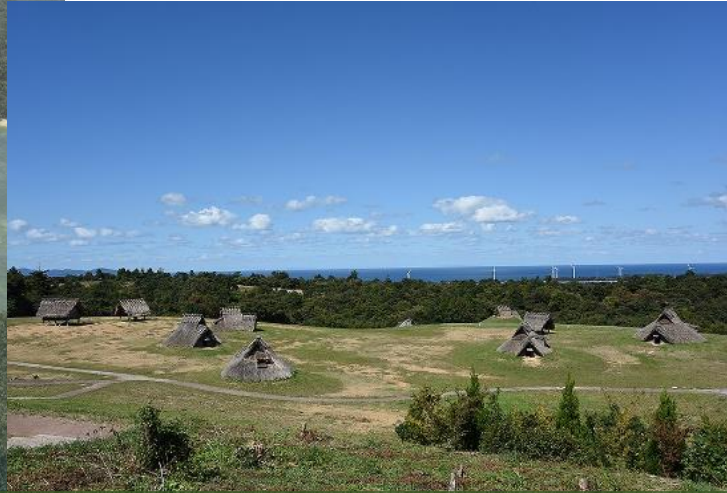
妻木晩田遺跡（西暦2世紀頃の集落景観）