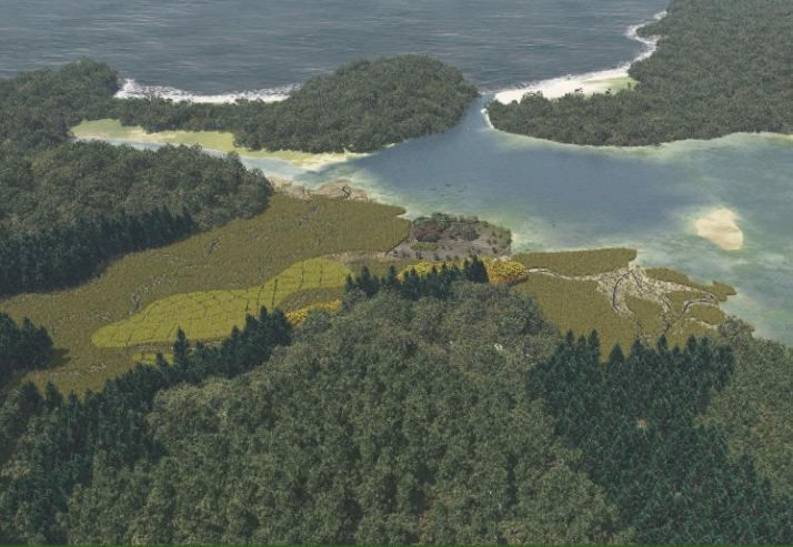
青谷上寺地遺跡（西暦2世紀頃の周辺環境）