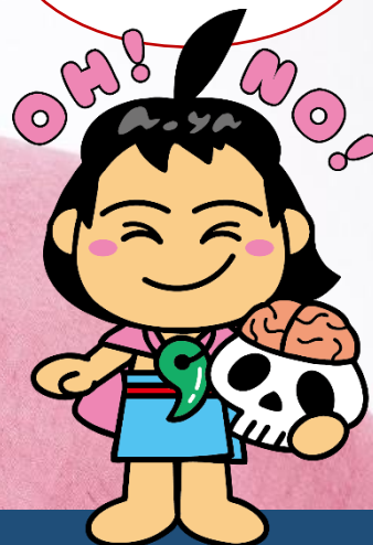
「青谷弥生人」復顔像(愛称:青谷上寺朗)