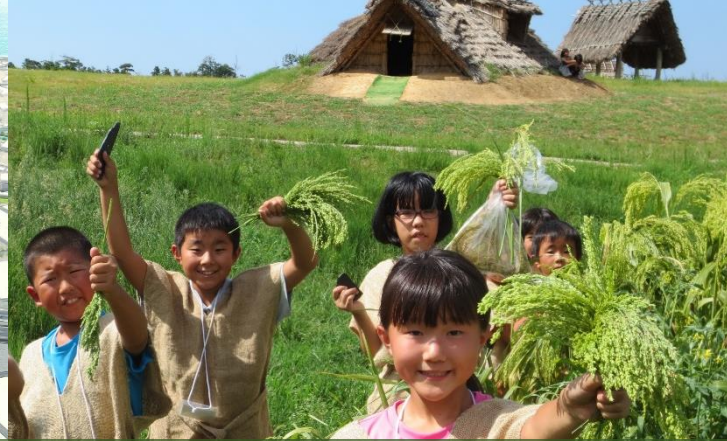
妻木晩田遺跡（弥生体験を楽しむ小学生）