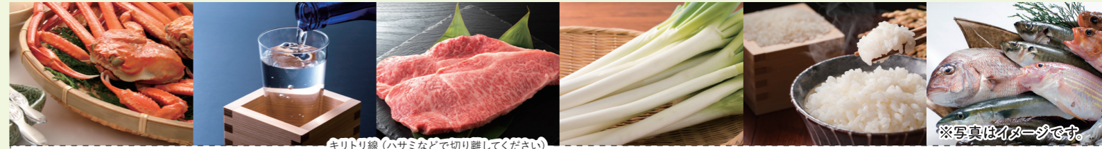
キトリ線(ハサミなどで切り離してください)

岡山県エリアを中心とした岡山県版の岡山米子線スタンプラリーも実施しています。岡山県版もぜひご応募ください!