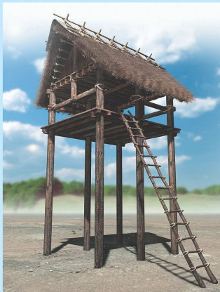
「弥生時代最長の柱材」による楼観復元CG

青谷上寺地遺跡にも存在した可能性がある楼観からの眺めを体感できるイベント「上って上って、楼観体験！」を開催しますので、ぜひ参加ください♪