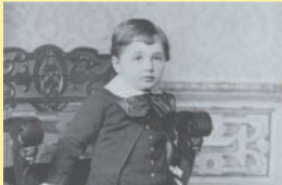
▲幼少時のアインシュタイン