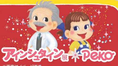
※画像はイメージです。 ※販売数には限りがあります。売り切れの場合はご容赦ください。

「舌出しポーズ」で おなじみのアイン シュタインと、不 二家のペコちゃんが コラボレーション!