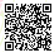
県立図書館ホームページ

〒680-0017 鳥取県鳥取市尚徳町101 電話: 0857-26-8155 ファクシミリ: 0857-22-2996 メール: toshokan@pref.tottori.lg.jp