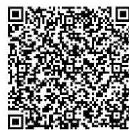
とっとり電子申請サービス