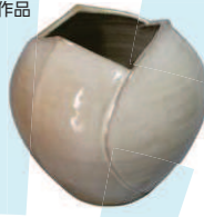
河本賢治氏作品 (糠釉花壺)