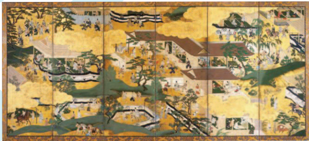
曾我物語図屏風(左隻)

公益財団法人鳥取市文化財団 鳥取市歴史博物館／鳥取市教育委員会 朝日新聞鳥取総局・共同通信社鳥取支局・山陰中央新報社・産経新聞社・時事通信社鳥取支局 新日本海新聞社・中国新聞鳥取支局・日本経済新聞社鳥取支局・毎日新聞鳥取支局・読売新聞鳥取支局 いなびよんびよんネット・NHK鳥取放送局・TSKさんいん中央テレビ・日本海テレビ 日本海ケーブルネットワーク・BSS山陰放送・エフエム山陰・株式会社F.M.鳥取