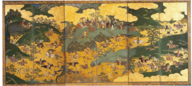
曾我物語図屏風(右隻)