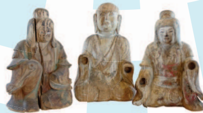
神像(米子市八幡神社蔵)