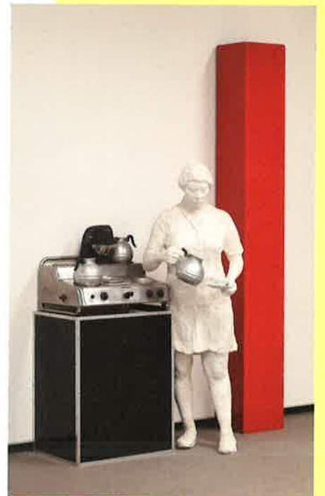
ジョージ・セガル【コヒーを注ぐウエイトレス】1973年 石膏、木、金属、磁器、プラスチック 滋賀県立近代美術館蔵