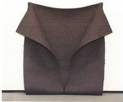
ロバート・モリス【無題】1972年 フェルト 滋賀県立近代美術館蔵