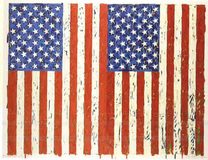
ジャスパー・ジョンズ【旗】1973年 トリグラフ紙 高松市美術館蔵 ©Jasper Johns/VAGA at ARS, NY / JASPAR, Tokyo 2019 C2641