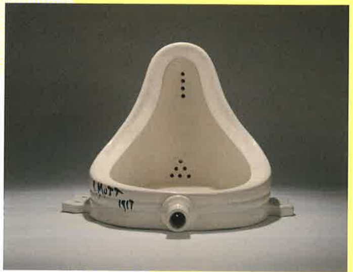
マルセル・デュシャン【泉】1917/64年 小便器(磁器)/レディメイド(シュヴァルツ版 ed. 6/6) 京都国立近代美術館蔵 ©Association Marcel Duchamp / ADAGR, Paris & JASPAR, Tokyo, 2019 C2642