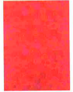
1. ナナ・スニ(ドレスデザイン)、アンナ＝リーサ・ニエミネン(テキスタイルデザイン)「サークル・パターン」ドレス、オーロラコレクション、1966～1967年、ウール・プリント、スオメントリコー社、タンペレ市立歴史博物館蔵、Photo/Jaana Sailyntoja 2. イルマリ・タピオヴァーラ「ドムスチェア」、1946年、木(白樺)・合板、クラヴァ木工、フィンランド・デザイン・ミュージアム蔵、Photo/Rauno Traskelin 3. クルト・エックホルム「AH」蓋つきボウル他、1935年、陶器(ファイヤンス焼)、アラビア製陶所、フィンランド・デザイン・ミュージアム蔵、Photo/Kirsi Halkola 4. マルアッタ・メツツォヴァーラ「花」、1962年、綿・プリント、タンペレ社、フィンランド・デザイン・ミュージアム蔵、Photo/Kirsi Halkola