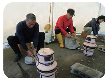
ふいごを使って炉を高温に