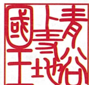
鳥取市青谷上寺地遺跡展示館 ▲R5.11.23まで ▼R6.3から 青谷かみじち史跡公園