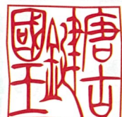
唐古・鍵考古学ミュージアム