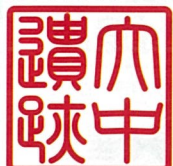
兵庫県立考古博物館 播磨町郷土資料館