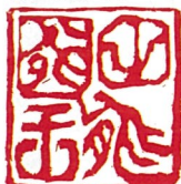
尼崎市立歴史博物館田能資料館