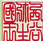
出雲弥生の森博物館