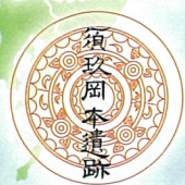
奴国の丘歴史資料館