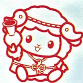
市立池上曾根弥生学習館