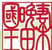
むさぼんだ史跡公園