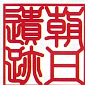
あい朝日遺跡ミュージアム