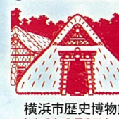
横濱市歴史博物館 ※令和6年2月2日まで 遺跡公園内工房にて押印

大小の集落・祭祀場・港湾・様々な形の墓・水田等... 地域色豊かな弥生時代を体感できる全国26遺跡