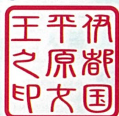
伊都国歴史博物館

お手持ちのメモ帳・ノート・御朱印帳などに押印します。 考古学者御用達、野帳(測量野帳)にも押印できます。