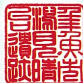
名古屋市見晴台考古資料館