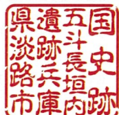
五斗長垣内遺跡活用拠点施設