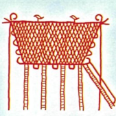
池上曾根弥生情報館