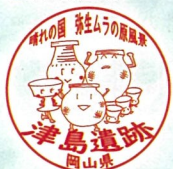
遺跡&スポーツミュージアム