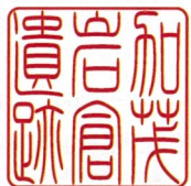
加茂岩倉遺跡ガイドス