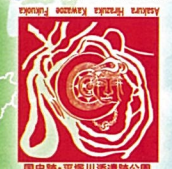
朝倉市平塚川添遺跡公園