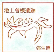
大阪府立弥生文化博物館