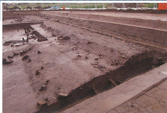
青谷上寺地遺跡で見つかった古代山陰道