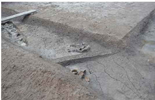
遺構が見つかった様子