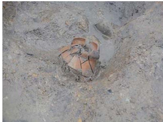
古墳時代前期前葉（約1,700年前）の土器