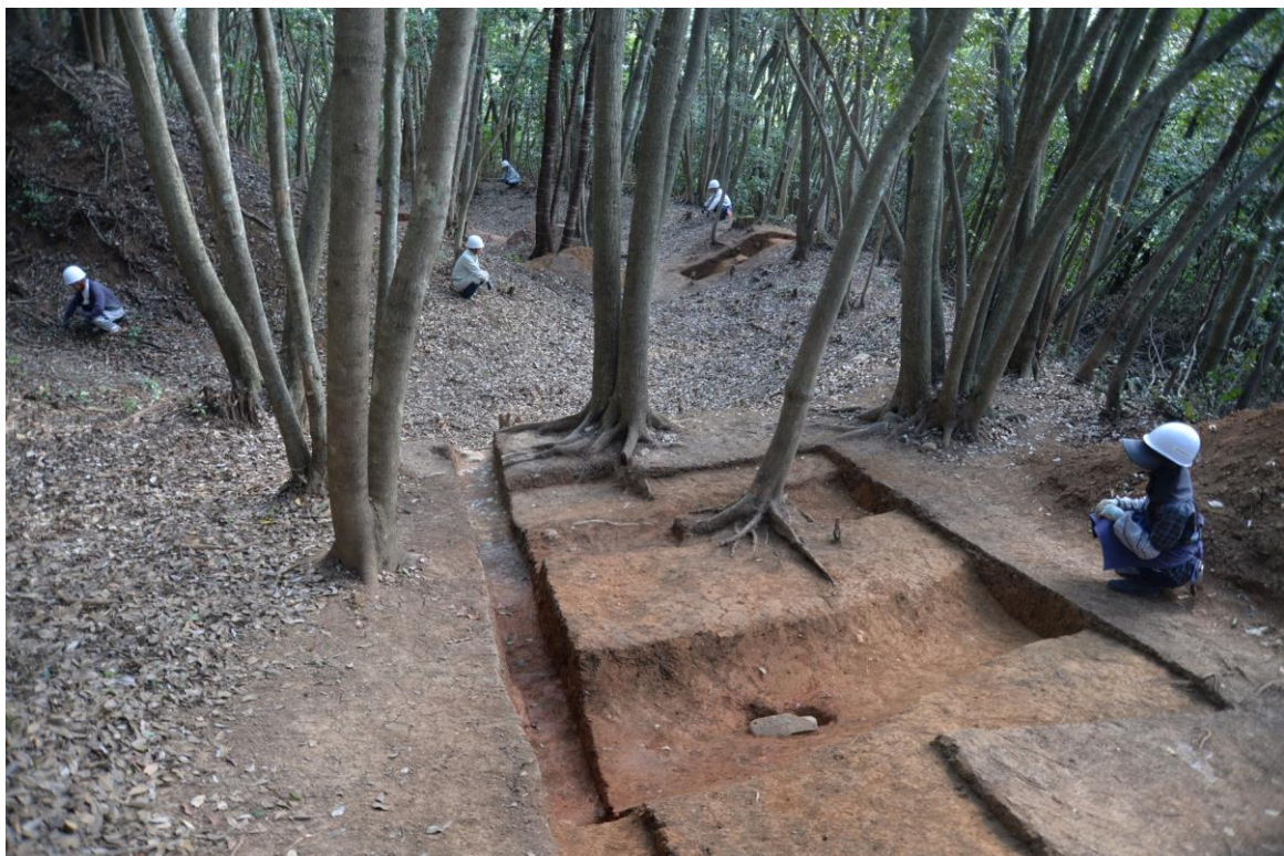
養郷宮之脇遺跡で発見されたつづら折りの道路遺構