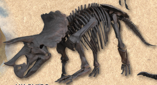
トリケラトプスの 全身骨格(複製)

空間演出のクリエイティブカンパニー NAKED, INC. 初の大型恐竜コンテンツ!