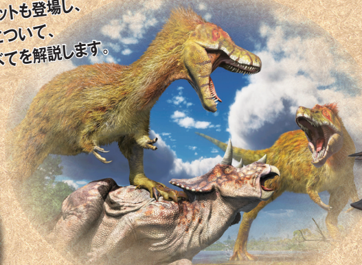
若いティラノサウルスの 狩りの様子