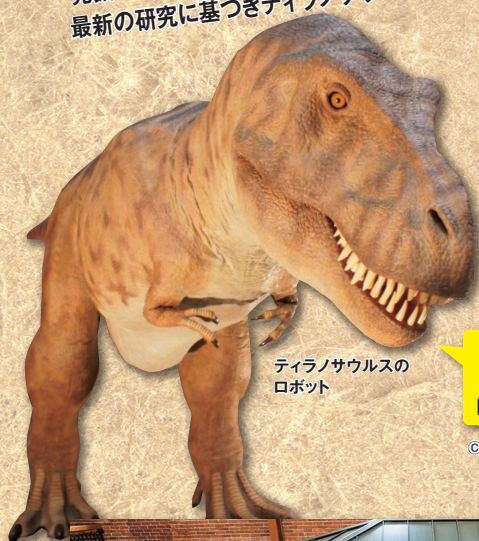
ティラノサウルスの ロボット