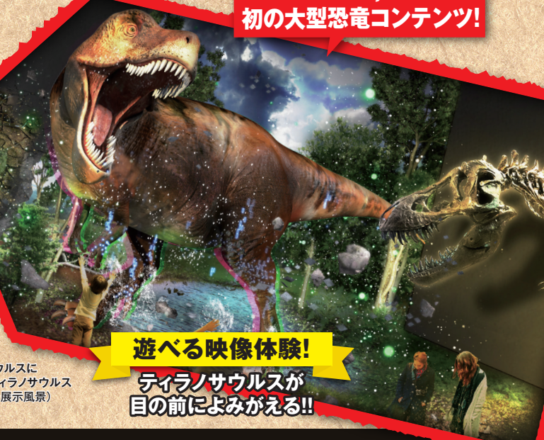
エドモントサウルスに 襲いかかるティラノサウルス (アメリカでの展示風景)