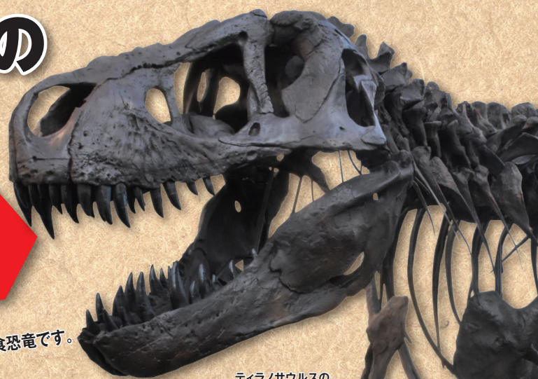
ティラノサウルスの 全身骨格(複製)

世界で最も有名で、最も人気の高い恐竜ティラノサウルス。「暴君竜」の名にふさわしく、太く鋭くつがった歯、頑丈で大きな頭を持つ最大級の肉食恐竜です。その他の大型恐竜や草食恐竜に加えてロボットも登場し、発掘・研究の歴史のほか、生態や能力などについて、最新の研究に基づきティラノサウルスのすべてを解説します。