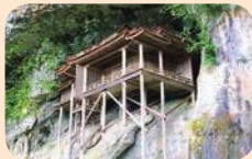
Mitokusan Sanbutsuji Temple (Nageiredo)