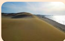
Tottori Sand Dunes