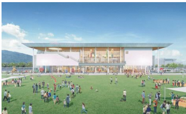
大屋根の下に多様な活動が展開する鳥取県立美術館の姿