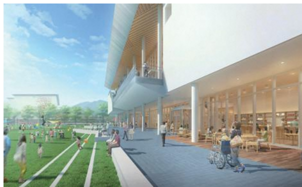
『ひろま』と大御堂廃寺跡をつなぐ『えんがわ』