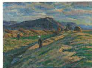
1 安岡信義《読書(緑陰)》1915年 カンヴァス・油彩 当館蔵 2 安岡信義《礪石山遠望》制作年不明 カンヴァス・油彩 鳥取市立湖南学園蔵