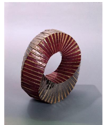
瀬戸浩 《メビウスー回転》 1973年 陶器