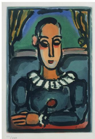
ジョルジュ・ルオー 《黒いピエロ》 1935年 アクアチント