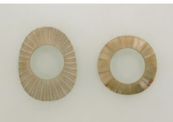
湯梨浜町 馬ノ山4号墳出土 車輪石