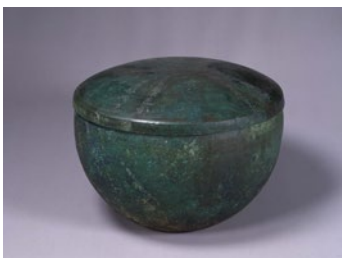
鳥取市 伊福吉部徳足比売骨蔵器(重要文化財)