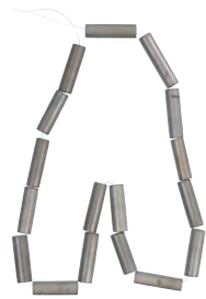
湯梨浜町 馬ノ山4号墳出土碧玉管玉 〔II 展示予定〕