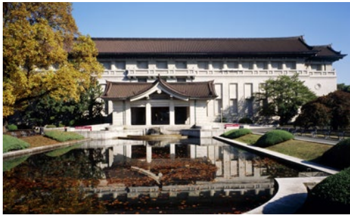
東京国立博物館 本館(重要文化財)

東京国立博物館(東博)は、上野公園(東京都台東区)に1872(明治5)年に設立された国内最古の博物館です。11万6000件以上という所蔵品は国宝・重要文化財をはじめとする日本の貴重な資料であり、その中には鳥取県にゆかりのある考古資料も多く含まれています。