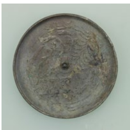
鳥取市 宇倍神社経塚出土 土和鏡