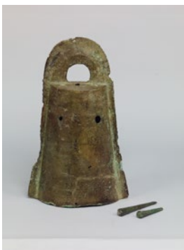
湯梨浜町小浜 銅鐸・舌 〔12月以降展示予定〕