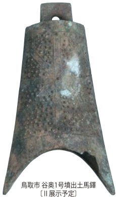
鳥取市 谷奥1号墳出土馬鐸 〔II 展示予定〕