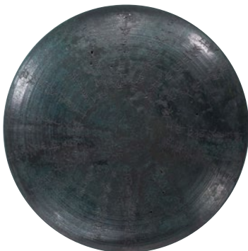
鳥取市 伊福吉部徳足比売骨藏器 蓋上面(重要文化財) 〔I 展示予定〕