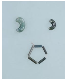
湯梨浜町 馬ノ山4号墳出土 硬玉勾玉・碧玉管玉