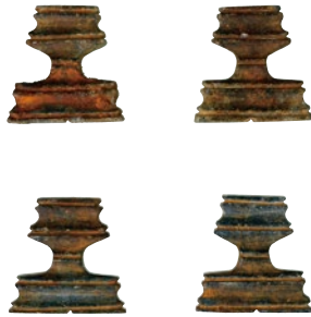
倉吉市 上神大將塚古墳出土琴柱形石製品 〔II 展示予定〕