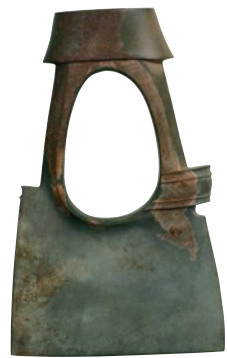
倉吉市 上神大將塚古墳出土鉄形石 〔II 展示予定〕