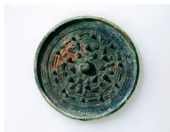
倉吉市 上神大将塚古墳出土 三角縁神獸鏡