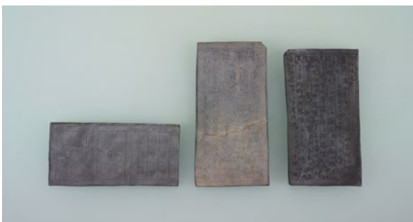
倉吉市 大日寺経塚出土 瓦経