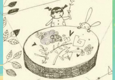
ライティング・テーブルで遊べるブースのイメージ