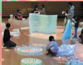
展示室内で行うワークショップのイメージ

※実施にあたっては、自主企画・持ち込み企画で原則ボランティアとし、営利目的の活動はできません。