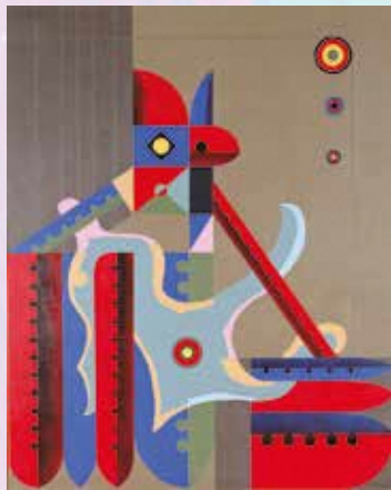
福留章太《アントロポス》1978年/当館蔵