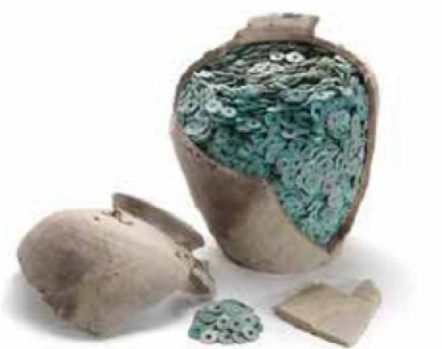
下坂本清合遺跡出土埋蔵銭(鳥取県埋蔵文化財センター所蔵)