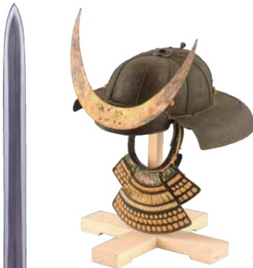
鉄鎧十二筋筋兜(吉川史料館所蔵)