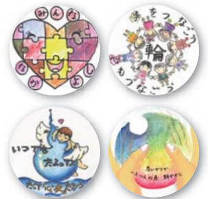
コンクール参加作品