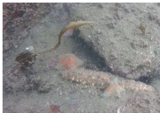
食害にあったと思われるワカメ