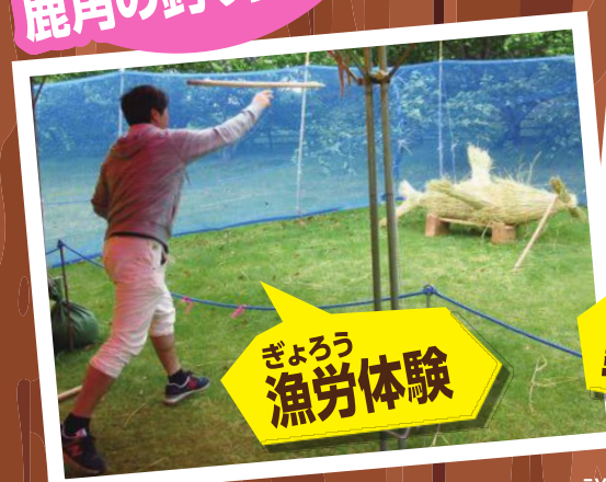
ぎょうろ漁労体験