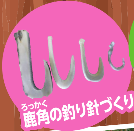
ろっかく鹿角の釣り針づくり