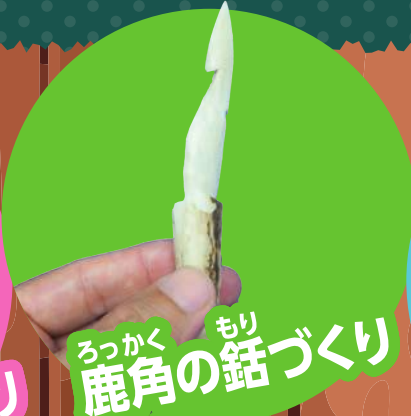
ろっかくもり鹿角の鉋づくり