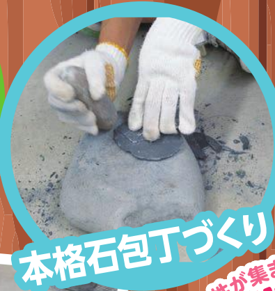
本格石包丁づくり