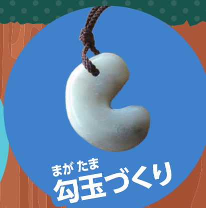
まがたま勾玉づくり