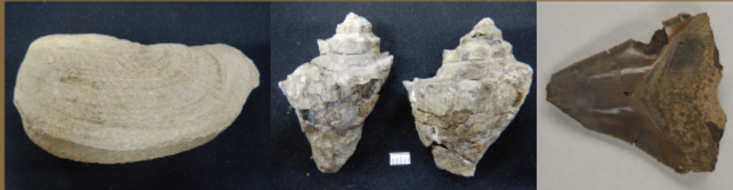
ツルナガホラドミヤ (日南町美術館所蔵) ミマサカソテガイ (日南町美術館所蔵) メガロドン歯 (鳥取県立博物館所蔵)