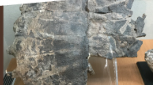
イシハラオオスッポン (庄原市立比和自然科学博物館所蔵)