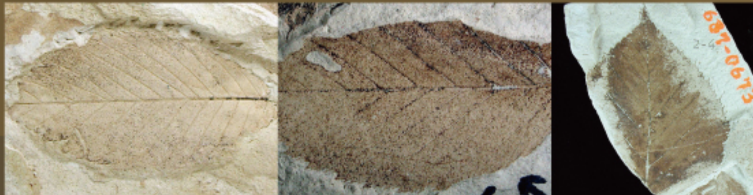
ムカシハルニレ (鳥取県立博物館所蔵) ヘイグンイヌシテ (鳥取県立博物館所蔵) ホウキカンバ (鳥取県立博物館所蔵)