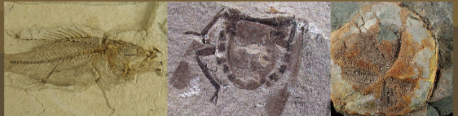
イナバケツギヨ (鳥取県立博物館所蔵) アカギカメムシ (鳥取県立博物館所蔵) トクナガムカシブツク (鳥取県立博物館所蔵)