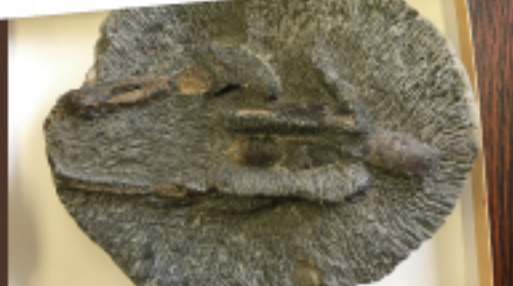
アナジャコ (どこでも博物館所蔵)