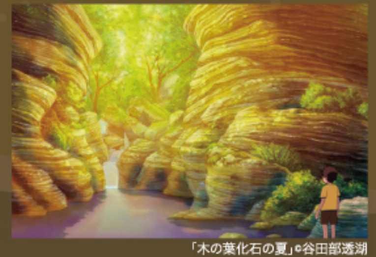
「木の葉化石の夏」©谷田部透湖

日時: 7月15日(日)、8月12日(日)、8月26日(日) 午前11時から1時間おきに上映(約10分) 場所: 当館2階講堂 定員250名(申込不要) (11:00~、12:00~、13:00~、14:00~、15:00~、16:00~、17:00~)