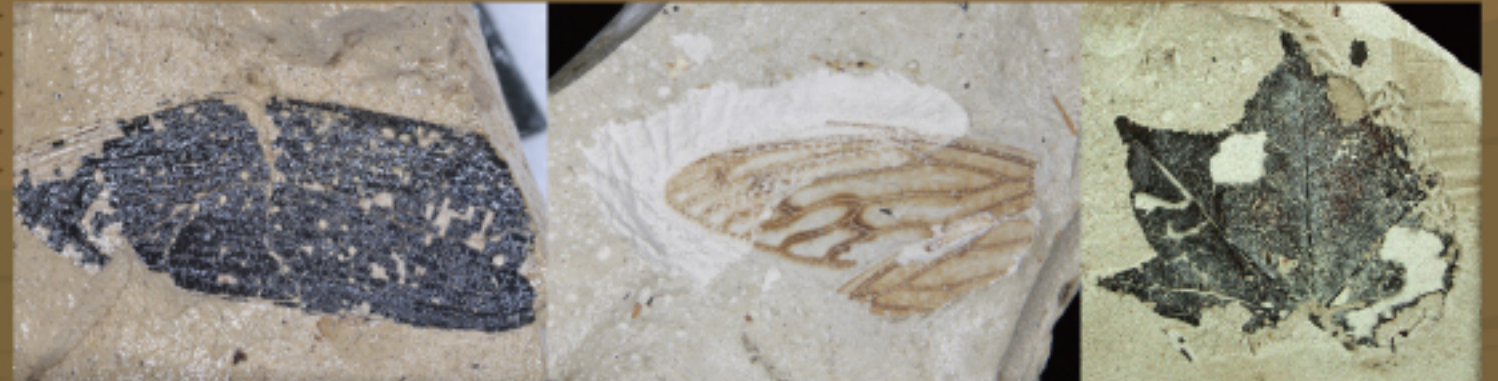
タツミトウゲオサムシ (大阪市立自然史博物館所蔵) イナバムカシアブラゼミ (鳥取県立博物館所蔵) カシイタヤ (鳥取県立博物館所蔵)