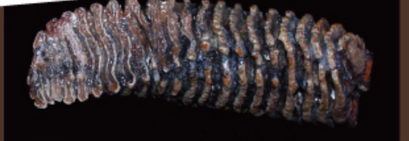
マンモス (鳥取県立博物館所蔵)